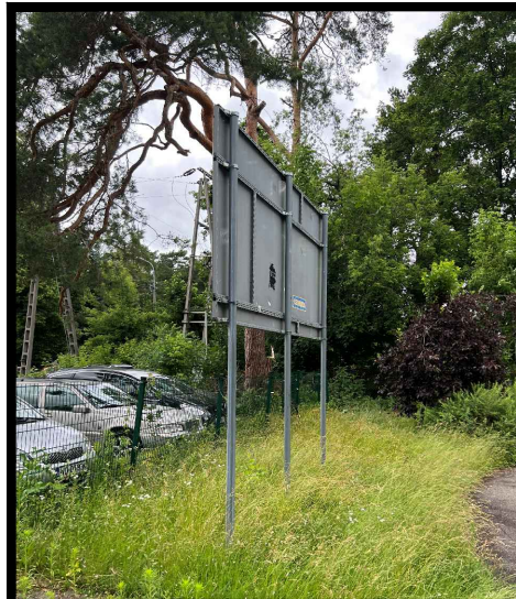
7 - tablica informacyjna: dł. 500 cm