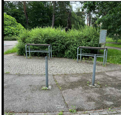
2 - słupki ( 11 szt.) 4 - ławki ( 7szt.) 9 - mała tablica informacyjna