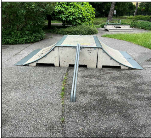
6 - rampa: 250x400cm