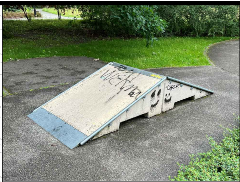
1 - rampa: 150x300cm