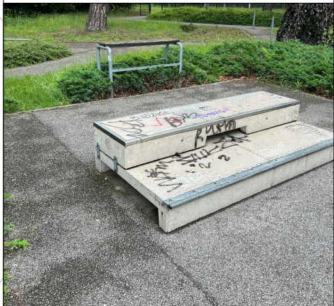
5 - rampa: 300x200cm