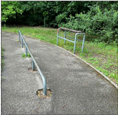
3 - rail: dł. 400 cm