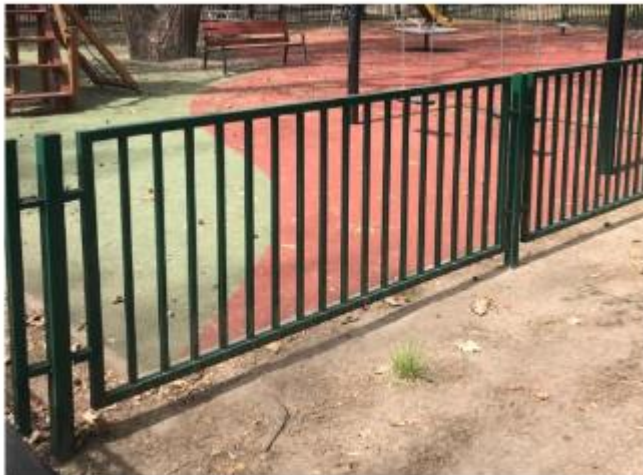
rys. 15 Zdjęcie poglądowe ogrodzenia