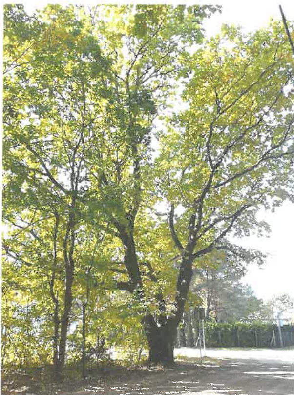
Fot. Katarzyna Zantonowicz (październik, 2023 r.)

podsumowujący przebieg konsultacji społecznych dotyczących projektu miejscowego planu zagospodarowania przestrzennego gminy Michałowice w rejonie ulic: Stara Droga, Polna i Rumiankowa na terenie obrębu geodezyjnego Komorów Wieś