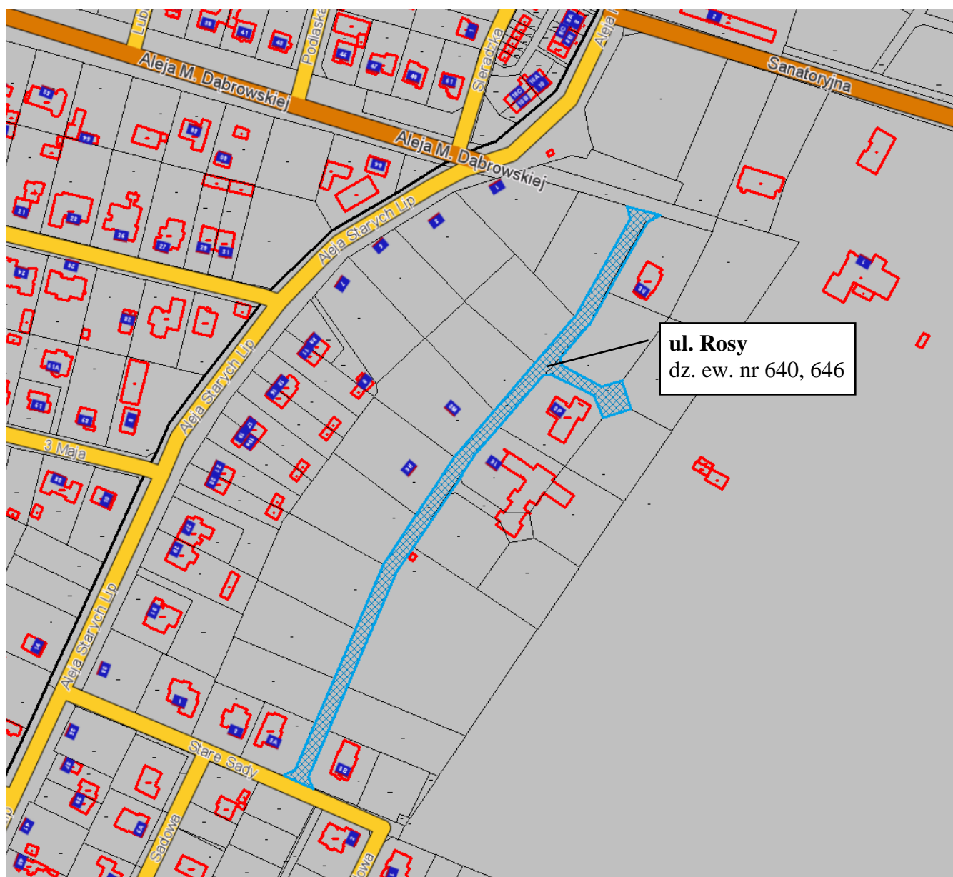
Komorów-Wieś, gm. Michałowice