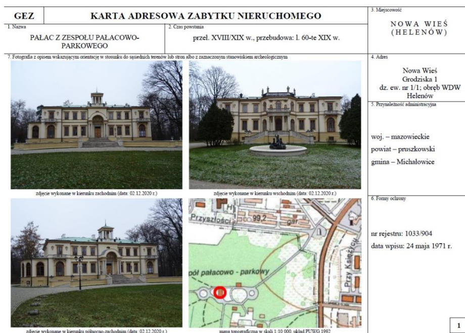
Rysunek 1 Przykładowa karta GEZ -awers

Gmina Michałowice podejmowała próby sporządzenia Gminnej Ewidencji Zabytków. Niestety na przestrzeni lat nie udało się w pełni zrealizować zamierzenia. W roku 2020 podjęto kolejną próbę opracowania GEZ. Na Gminną Ewidencję Zabytków składają się obiekty wpisane do rejestru zabytków, wojewódzkiej ewidencji zabytków oraz obiekty dodatkowo ujęte w ewidencji wytypowane przez Władze Gminy.