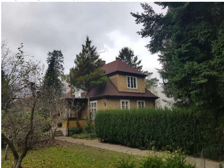
zdjęcie wykonane w kierunku wschodnim (data: 20.11.2020 r.)

7. Fotografia z opisem wskazującym orientację w stosunku do sąsiednich terenów lub stron albo z zaznaczonym stanowiskiem archeologicznym