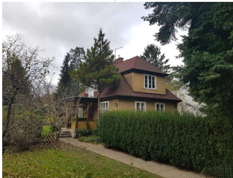
zdjęcie wykonane w kierunku wschodnim (data: 20.11.2020 r.)