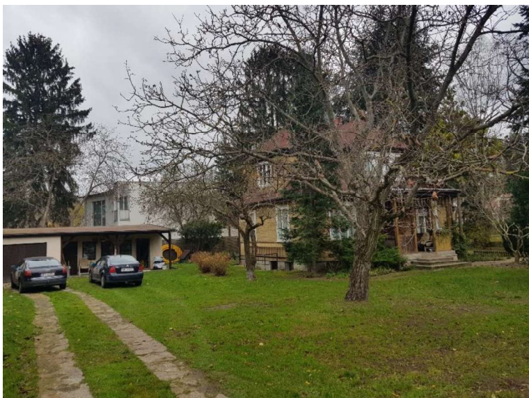
zdjęcie wykonane w kierunku północno-wschodnim (data: 20.11.2020 r.)